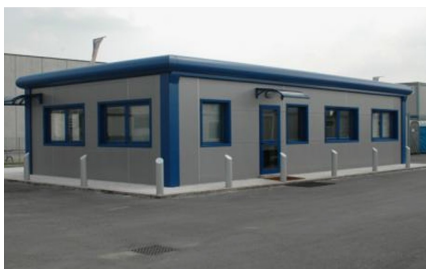
Aplicación especial a pedido en 1 nivel

Nota: Otras medidas y configuraciones disponibles bajo pedido especial a fábrica. Consúltenos para mas información.