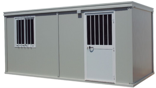
Monobloque NIC15 Sistema Modular de Construcción