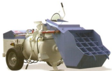
MT89 Mezcladora y transportadora de mortero