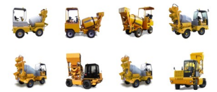
Auto-Hormigoneras Serie DB