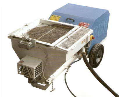
Revocadora P11 Máquina transportadora de mortero