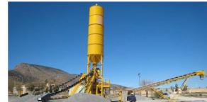
Serie TORRE Plantas de Concreto